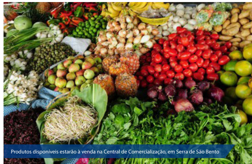
Produtos disponíveis estarão à venda na Central de Comercialização, em Serra de São Bento

A lista de produtos disponíveis foi apresentada aos empresários da região e estarão à venda na Central de Comercialização, no espaço Titanic, em Serra de São Bento.