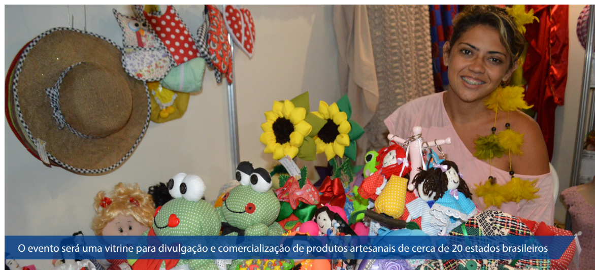
O evento será uma vitrine para divulgação e comercialização de produtos artesanais de cerca de 20 estados brasileiros

As inscrições seguem até o dia 14 de março e para realizá-la será necessário preencher o formulário de inscrição e apresentar os seguintes documentos: Artesão individual - Carteira do Artesão, documentos pessoais, comprovante de residência (dos últimos três meses), três fotos das peças artesanais que serão expostas e uma foto do rótulo ou embalagem dos produtos; Associações e cooperativas - relação dos artesãos que serão beneficiados, comprovante de endereço da sede da entidade, CNPJ, cópia do estatuto, cópia da Ata de Constituição e da eleição da diretoria atual, três fotos das peças que serão