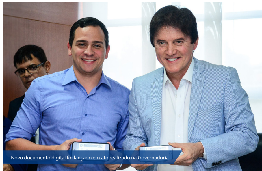
Novo documento digital foi lançado em ato realizado na Governadoria

A solicitação da CNH-e é opcional e no Rio Grande do Norte não vai gerar nenhum custo ao condutor. A funcio-